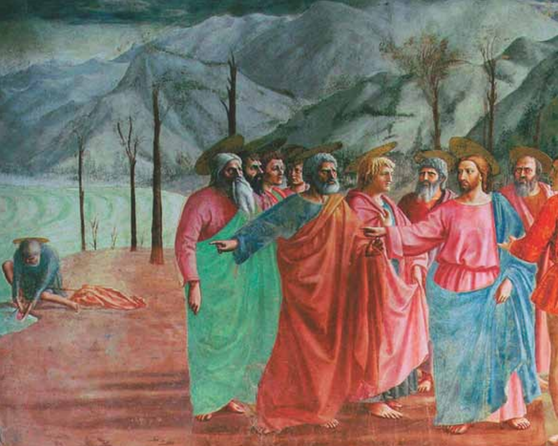
«Il pagamento del tributo» di Masaccio, affresco nella Cappella Brancacci di Firenze.